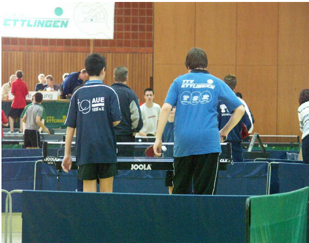
Oben: ein Doppel in voller Aktion. Aber: Wo sind die Gegner?

Im nächsten ploppy: Tischtennis und Schule (Fortsetzungen)