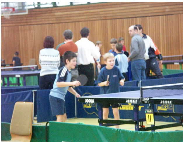
Unten: Ach, da sind sie ja! Ich glaube, die Kleinen haben das Doppel sogar gewonnen