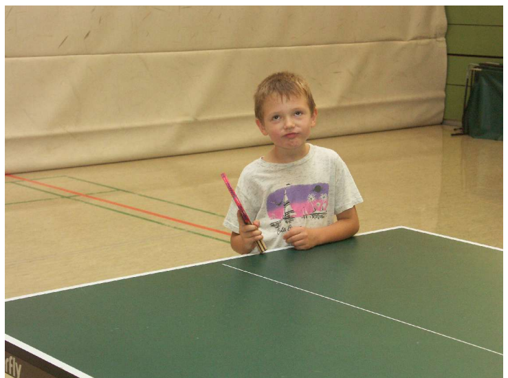
„Sonst kam der Ball immer wieder ...“

Thema „Schiedsrichter“ ! Wieso haben die unterschiedliche „Uniformen“ ? Wie wird man Schiedsrichter? Was ist der Unterschied zwischen Zähl- und Oberschiedsrichter? - und mehr!