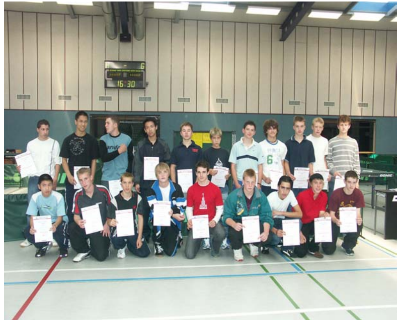
Die besten 20 der Top 40 – männliche Jugend