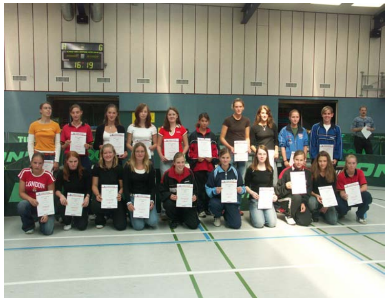
Die Mädchen. Platz 1-10 stehen hinten, 11- 20 sitzen davor

Alle Fotos dieser Veranstaltung könnt ihr auf www.tt-fotos.de sehen. Wer eine CD mit allen Bildern möchte, kann sich melden!